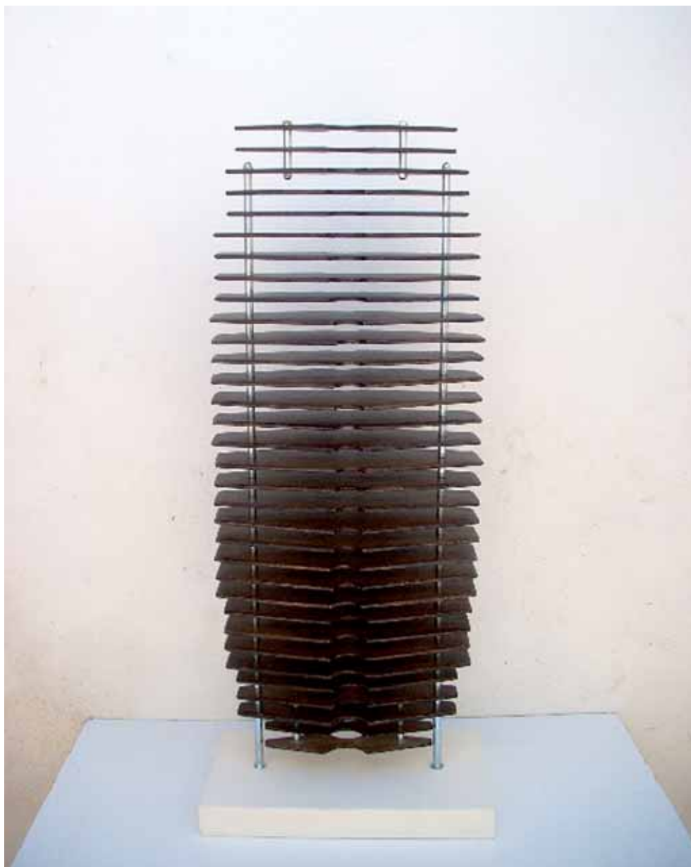
ANTONIO CABAU • Sanaa Tower, D. • Laca sobre metales • 35 x 82 x 20 cm.