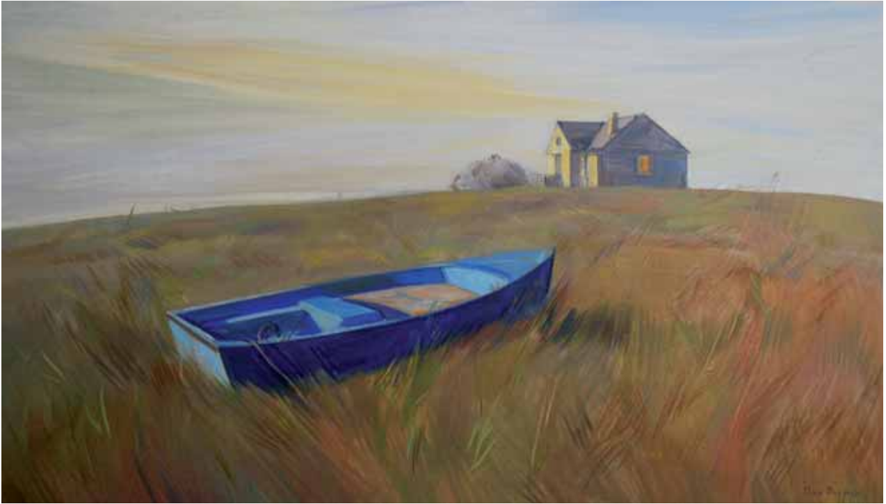
ÀLEX PRUNÉS • Resonancia • Óleo sobre lienzo • 65 x 114 cm.