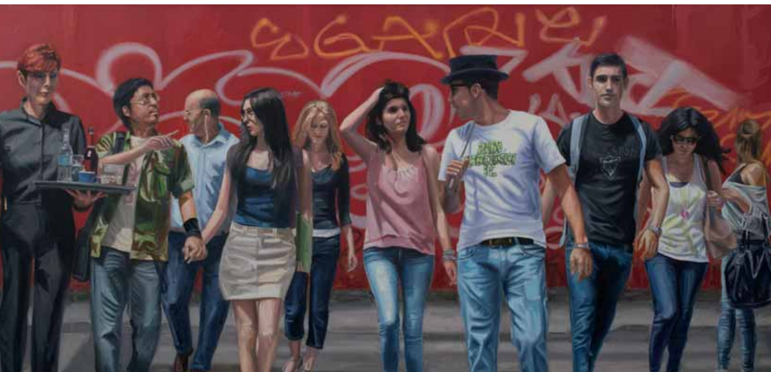
M. ÁNGELES CAMPÓN • Graffiti Rojo • Óleo sobre lienzo, 92 x 195 cm.