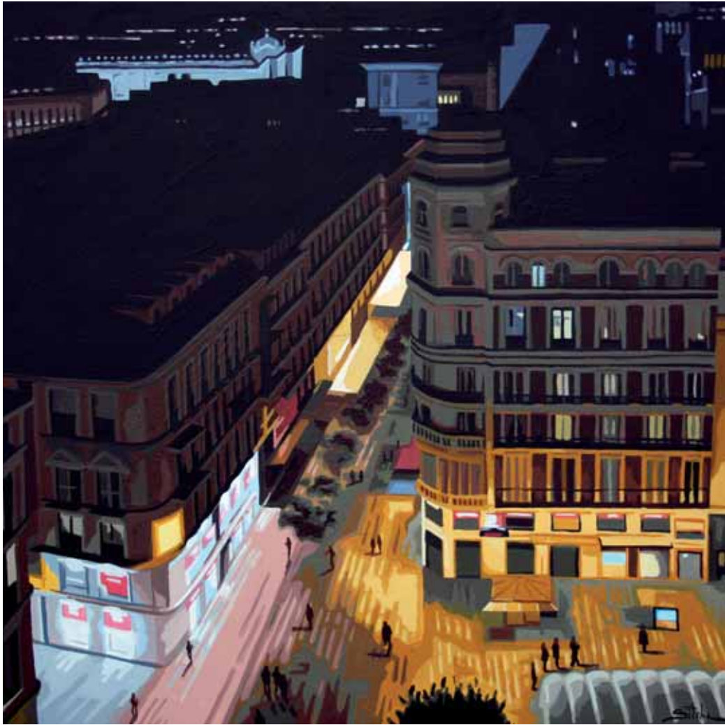
ROSANA SITCHA • Callao 21:45 • Acrílico sobre tabla • 50 x 50 cm.