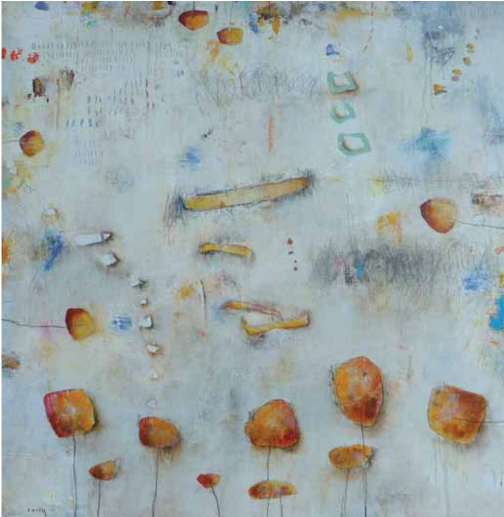
PACO CONESA • En el jardín • Técnica mixta sobre lienzo • 100 x 100 cm.