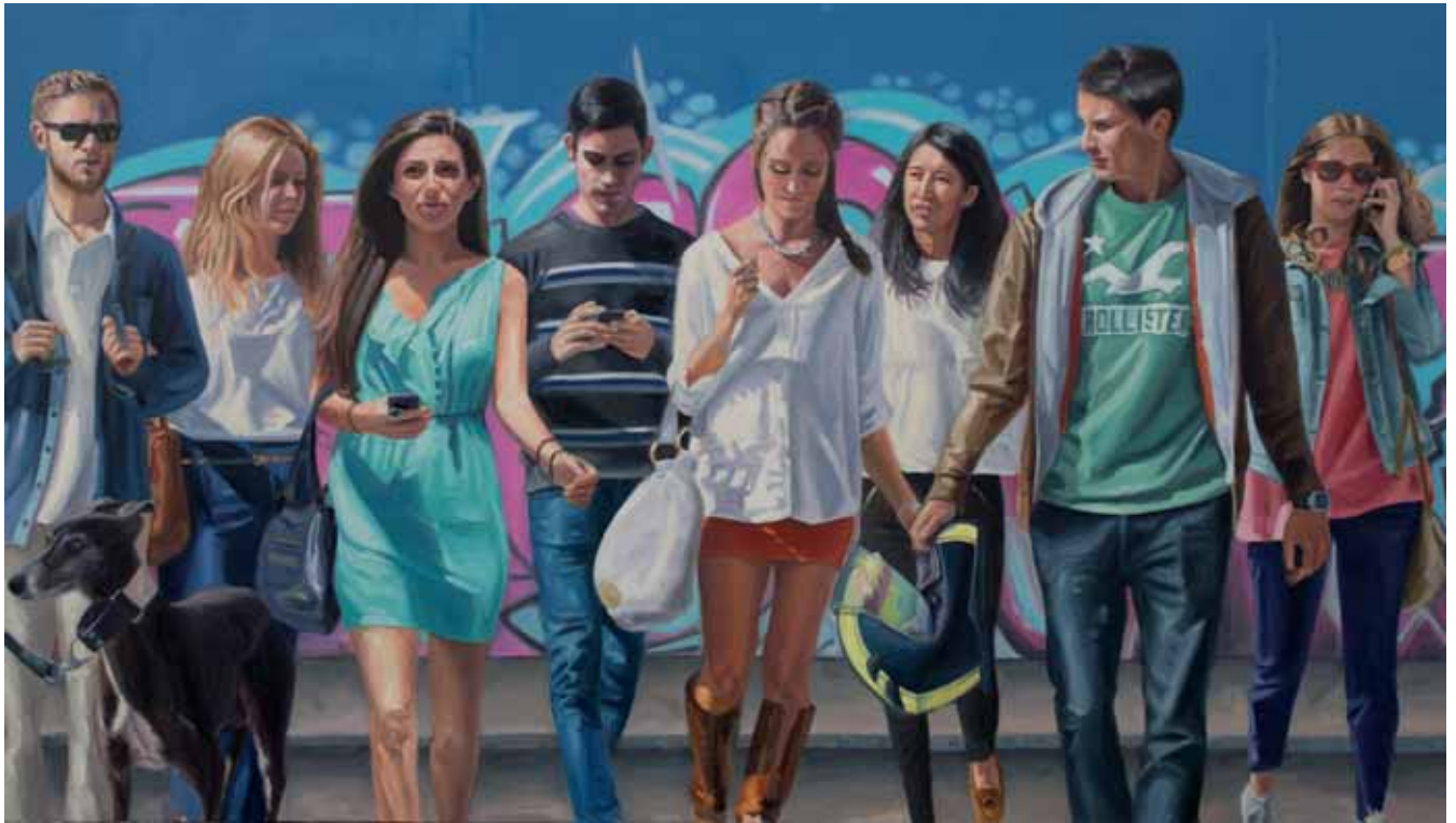
M. ÁNGELES CAMPÓN • Graffiti Azul • Óleo sobre lienzo • 92 x 150 cm.