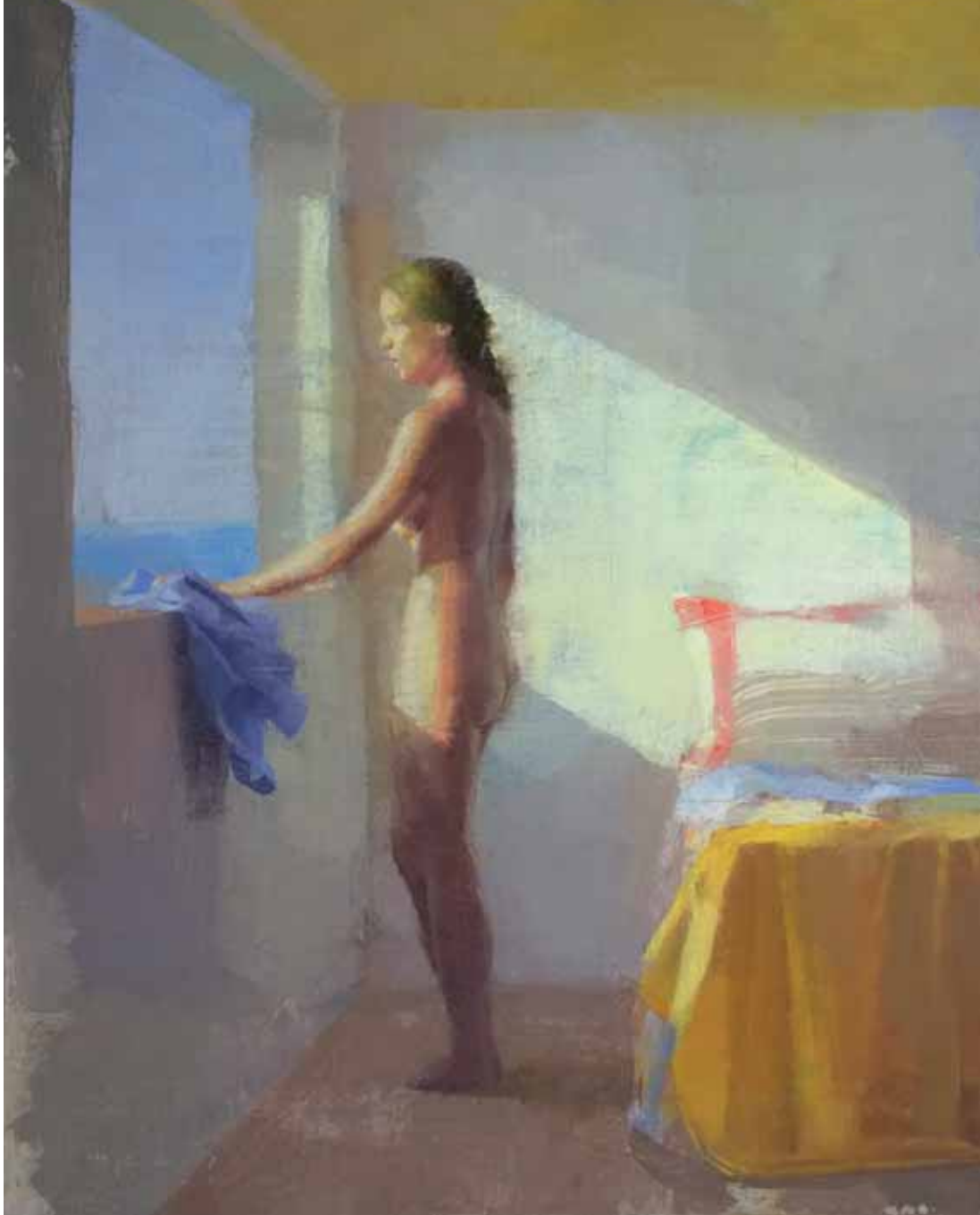
ALEJANDRA CABALLERO • Despertar • Óleo sobre lienzo • 81 x 65 cm.