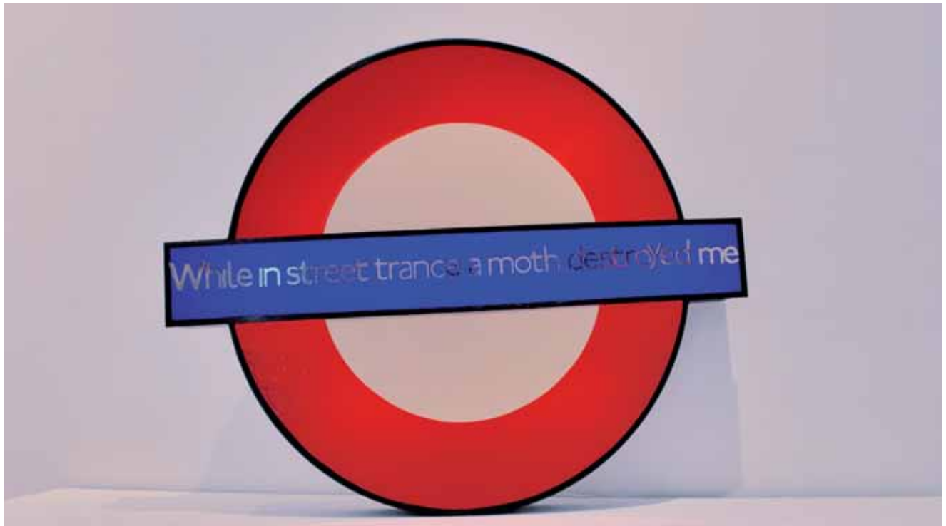
FLAVIA MUNÁRRIZ • While in street trance • Óleo y metacrilato sobre caja de luz • Ø 100 cm.