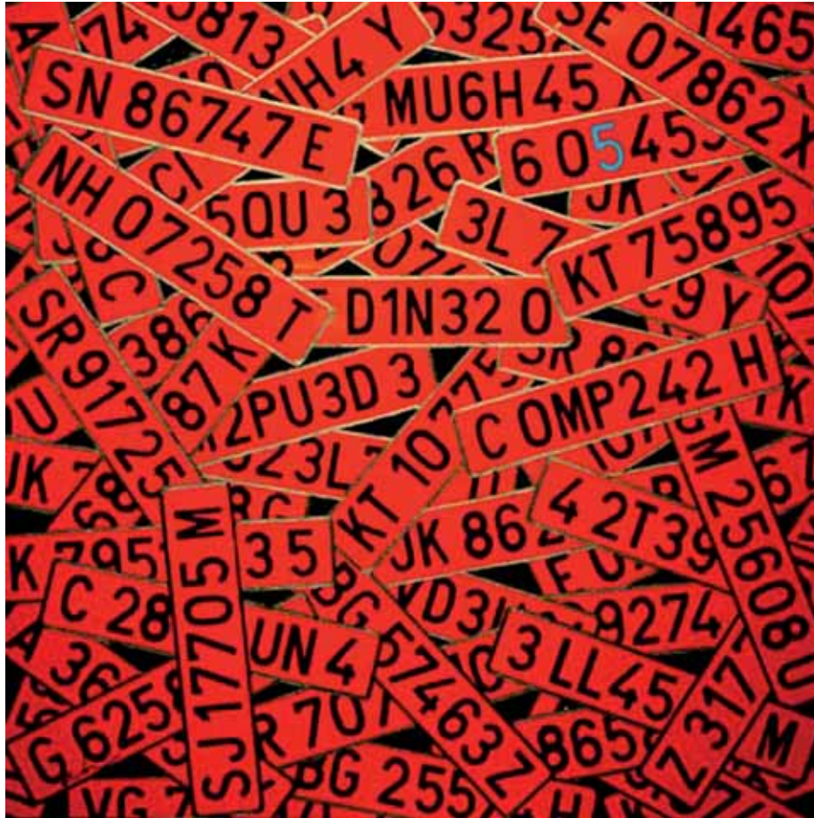
FLAVIA MUNÁRRIZ • Hay muchas cosas que el dinero puede comprar el arte es una de ellas Óleo y metacrilato sobre caja de luz • 130 x130 cm.