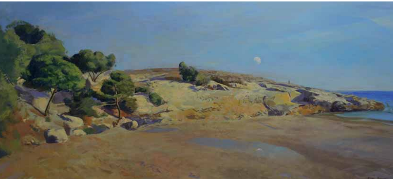
ÀLEX PRUNÉS • Playa • Óleo sobre lienzo • 65 x 146 cm.