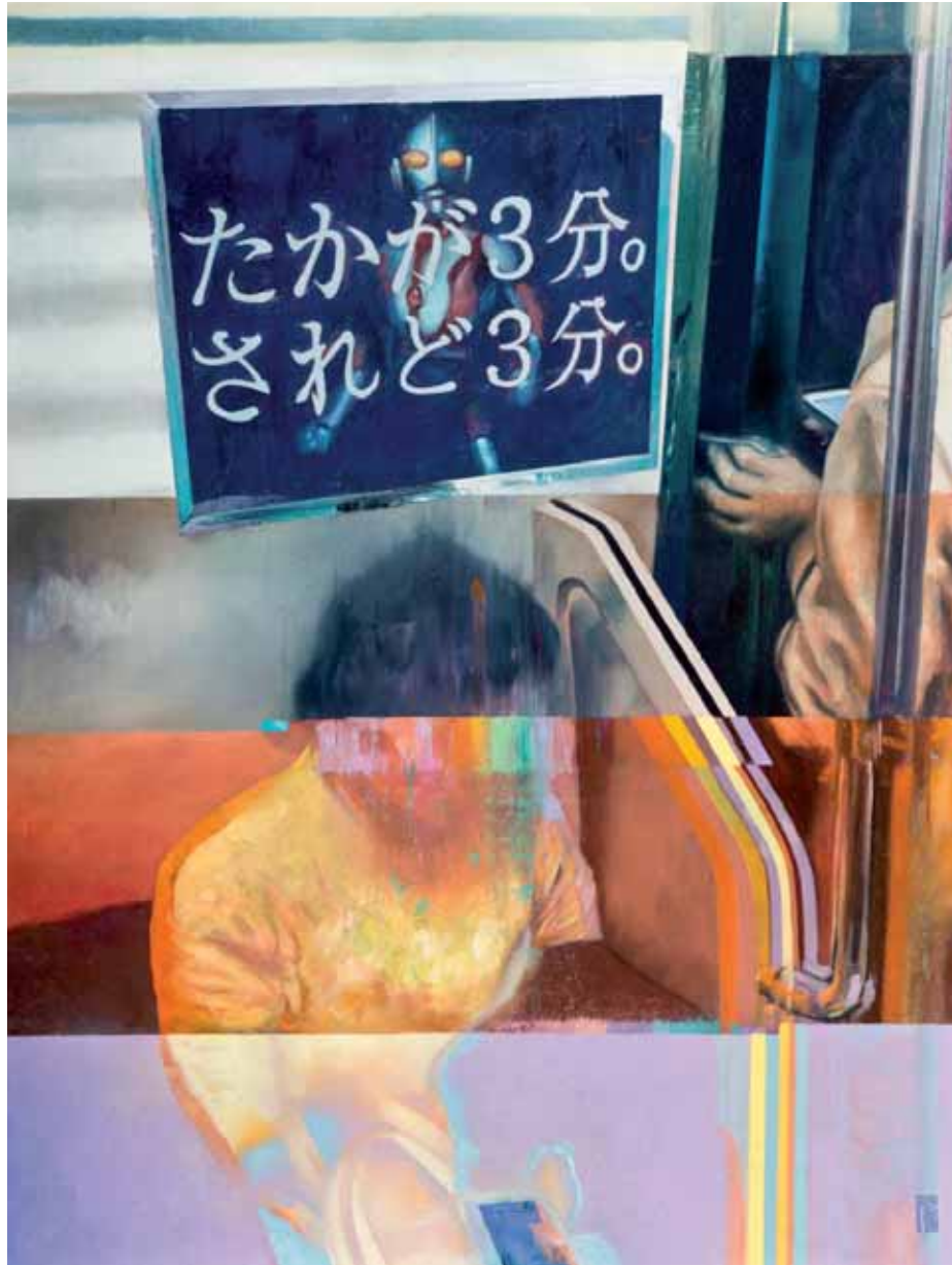
ROBERTO SILVA • Shimokitazawa • Óleo sobre lienzo • 97 x 127 cm.