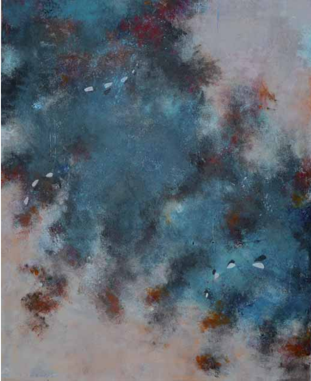
PACO CONESA • Nebulosa • Técnica mixta sobre lienzo • 100 x 181 cm.