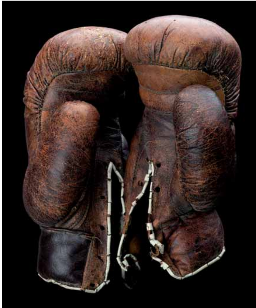
ABRAHAM CALERO • Guantes • Papel siliconado a metacrilato sobre dibond de aluminio • 60 x 50 cm.