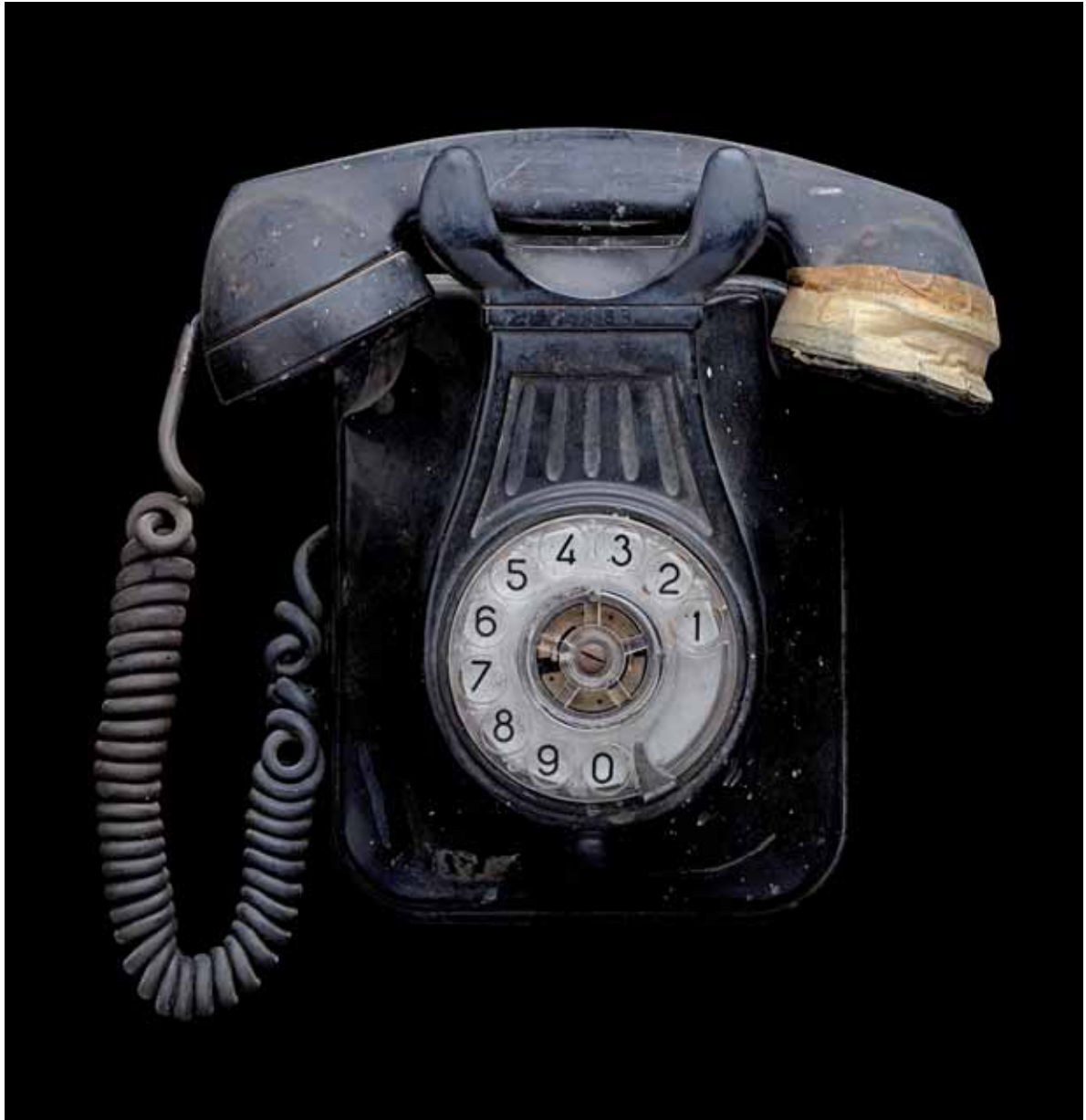
ABRAHAM CALERO • Teléfono • Papel siliconado a metacrilato sobre dibond de aluminio 112 x 108 cm.