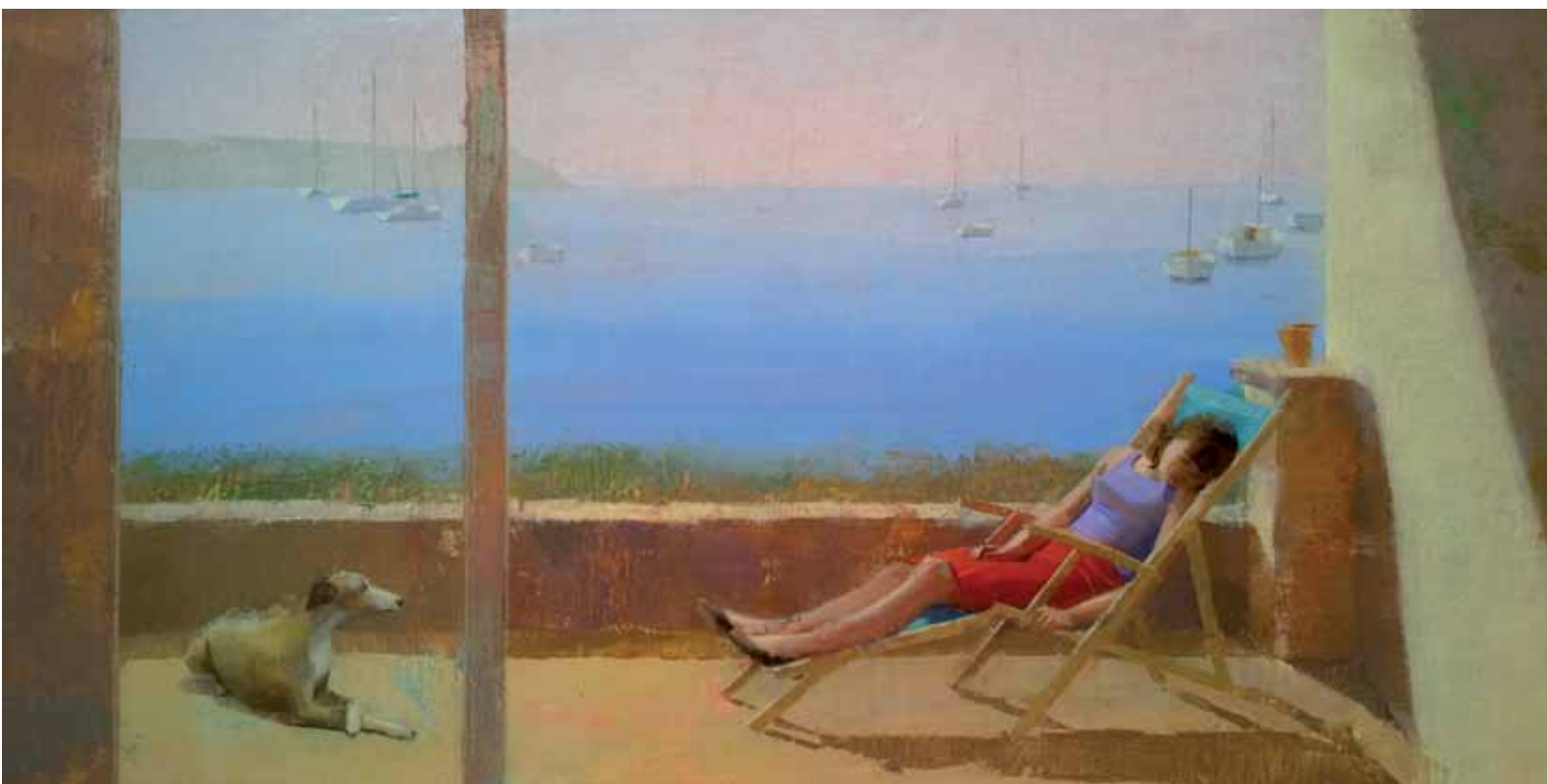
ALEJANDRA CABALLERO • Siesta • Óleo sobre lienzo • 50 x 100 cm.